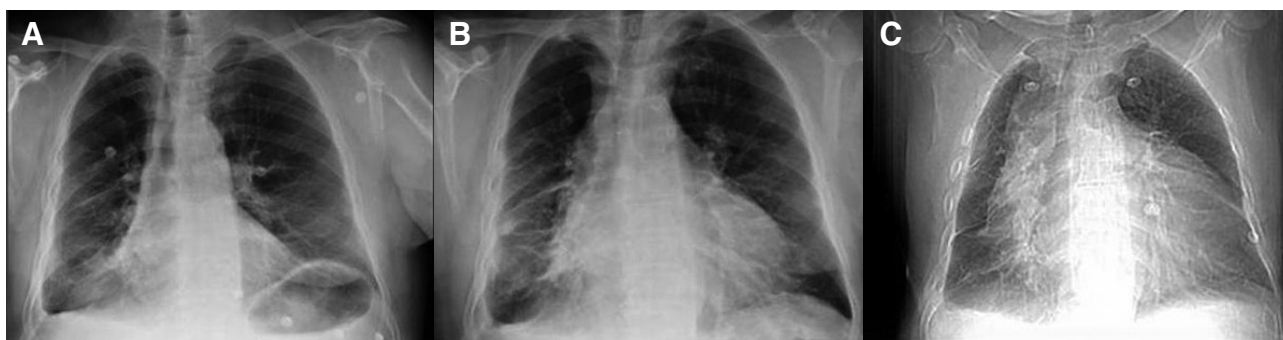
Figura 1. Evolución de la radiografía de tórax a lo largo de los diez días que el enfermo ha acudido a urgencias. A: primera visita, se aprecia discreta cardiomegalia y patrón pulmonar congestivo, así como derrame pleural derecho. B: segunda visita: es evidente el crecimiento de la silueta cardíaca y su morfología en tienda de campaña. C: cuarta visita, gran cardiomegalia.

diografía urgente y precoz, que continúa siendo la prueba de referencia para el diagnóstico del derrame pericárdico y del taponamiento cardíaco. Por ello, debe ser accesible realizarla en el servicio de urgencias 4,5 .